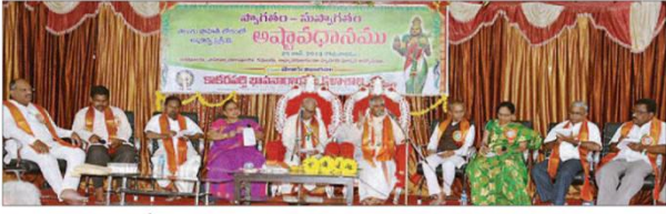
వేదికపై జనరంజకంగా అష్టావధానం నిర్వహిస్తున్న ప్రముఖులు