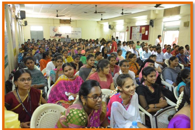
Participants at the Programme