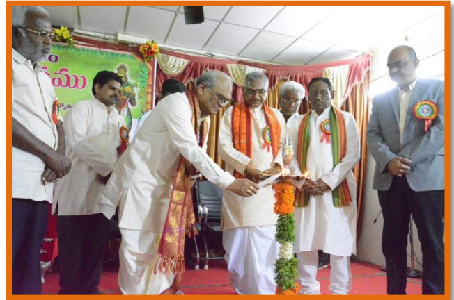
Lightening of the lamp