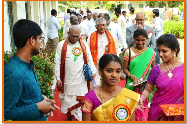
Guests arriving to the Programme